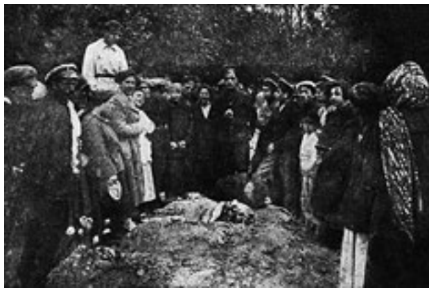
Могила 37 евреев-милиционеров, убитых галицийскими сечевиками при вступлении Петлюры в Киев после отхода большевиков

Одновременно, впрочем, творились и совсем не смешные вещи. Петлюровская печать развернула оголтелую пропаганду превосходства украинцев над другими народами, «хлопцям» официально рекомен-