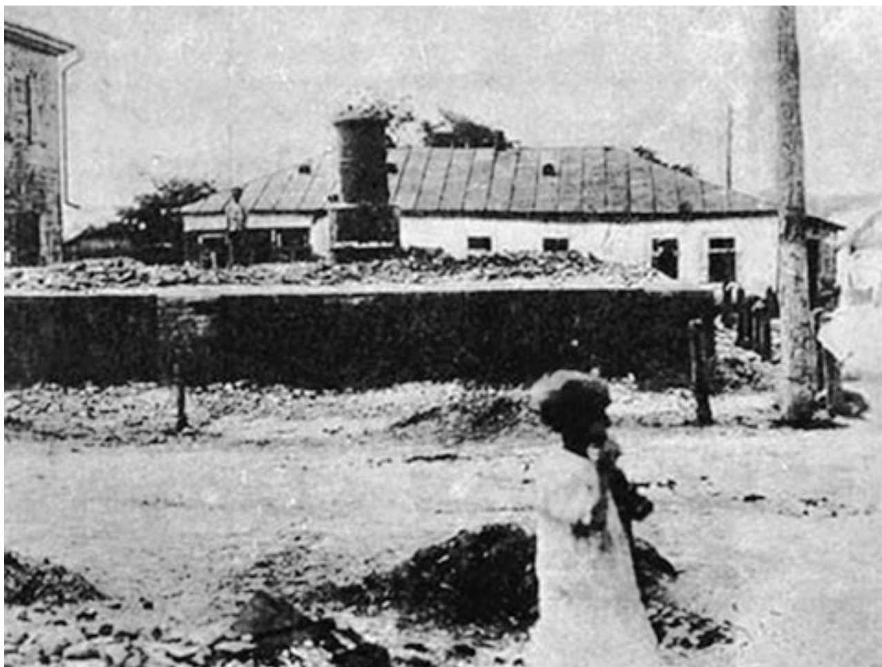
Богуслав после погрома. Случайно уцелевший ребенок блуждает по развалинам, отыскивая родных

С приходом к власти Петлюры по стране прокатились страшные еврейские погромы. Сошлемся здесь на одного из самых скрупулезных историков Гражданской войны, выдающегося русского писателя, лауреата Нобелевской премии Александра Исаевича Солженицына: «С декабря 1918 по август 1919 петлюровцы устроили десятки погромов, в ходе которых, по данным комиссии Международного Красного Креста, было убито около 50 тысяч человек... Шли без перерыва еврейские погромы, начавшиеся почти одновременно с организацией украинской власти, ставшие особенно жестокими в период так называемой директории и не прекращавшиеся до тех пор, пока существовала вооруженная украинская сила...»