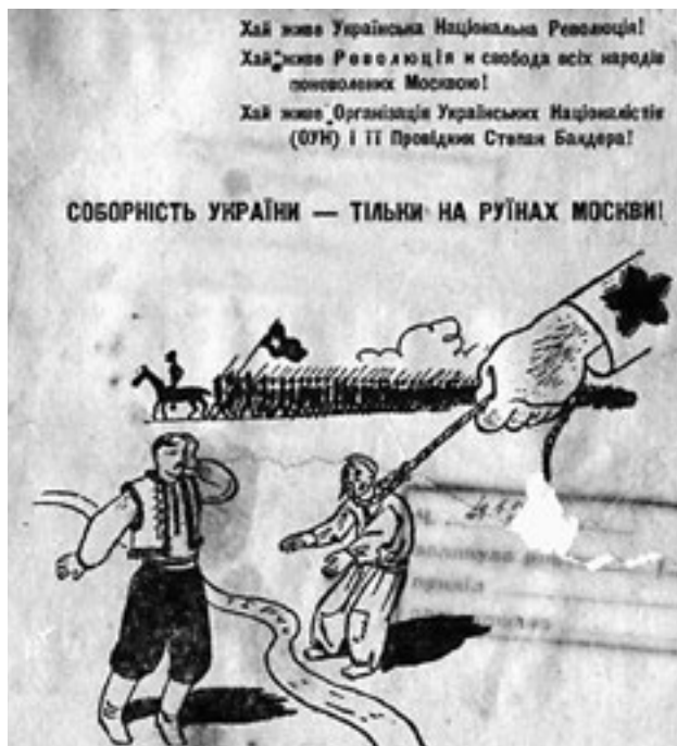
Листовка ОУН 1 . Ненависть ко всему русскому дала обильные всходы

Конечно, Россия не могла допустить такого развития событий. То, что происходит сегодня, — закономерный финал,