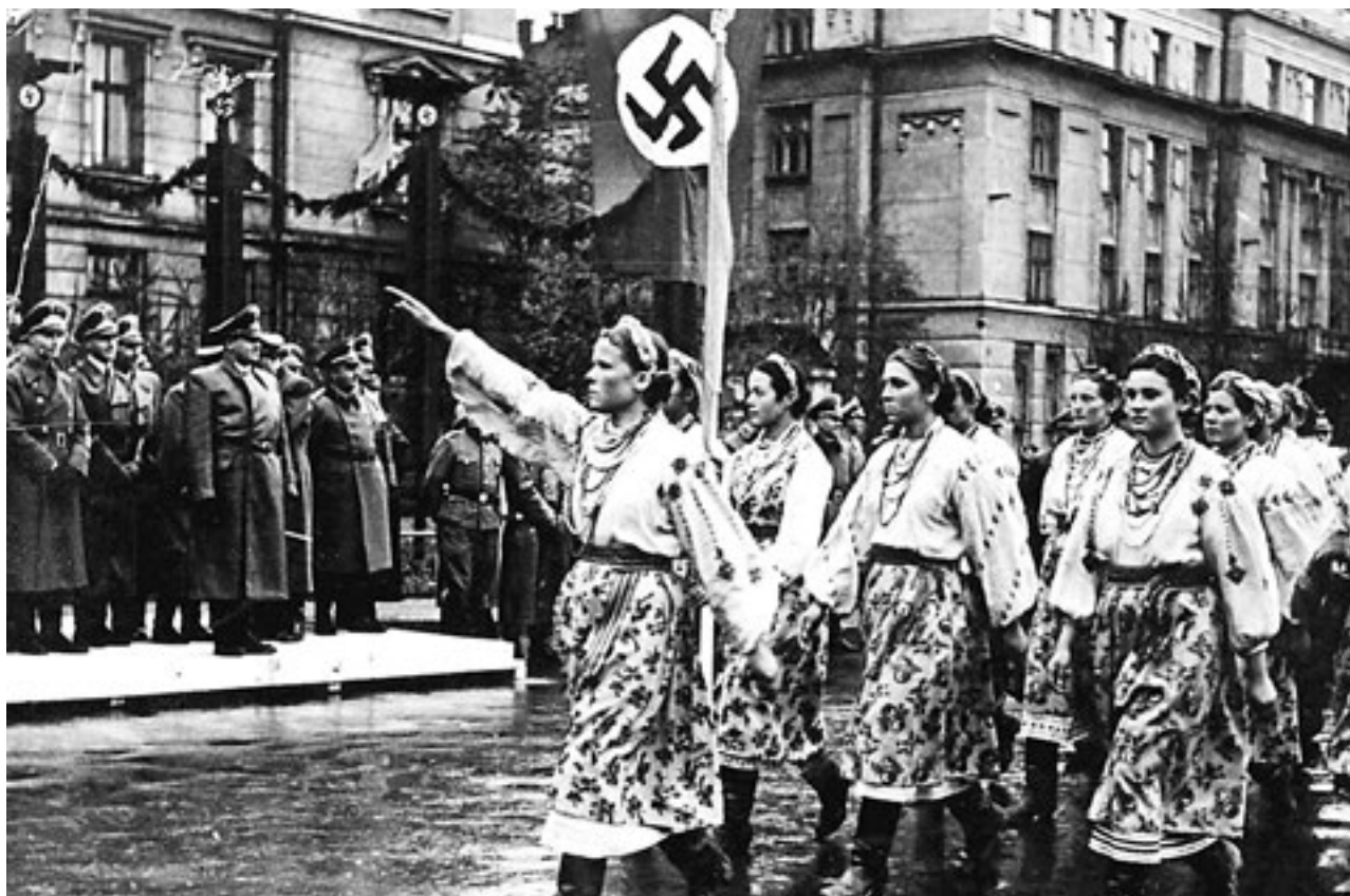
Парад в Ивано-Франковске в честь визита генерал-губернатора Польши рейхсфюрера Ганса Франка, 1941 год