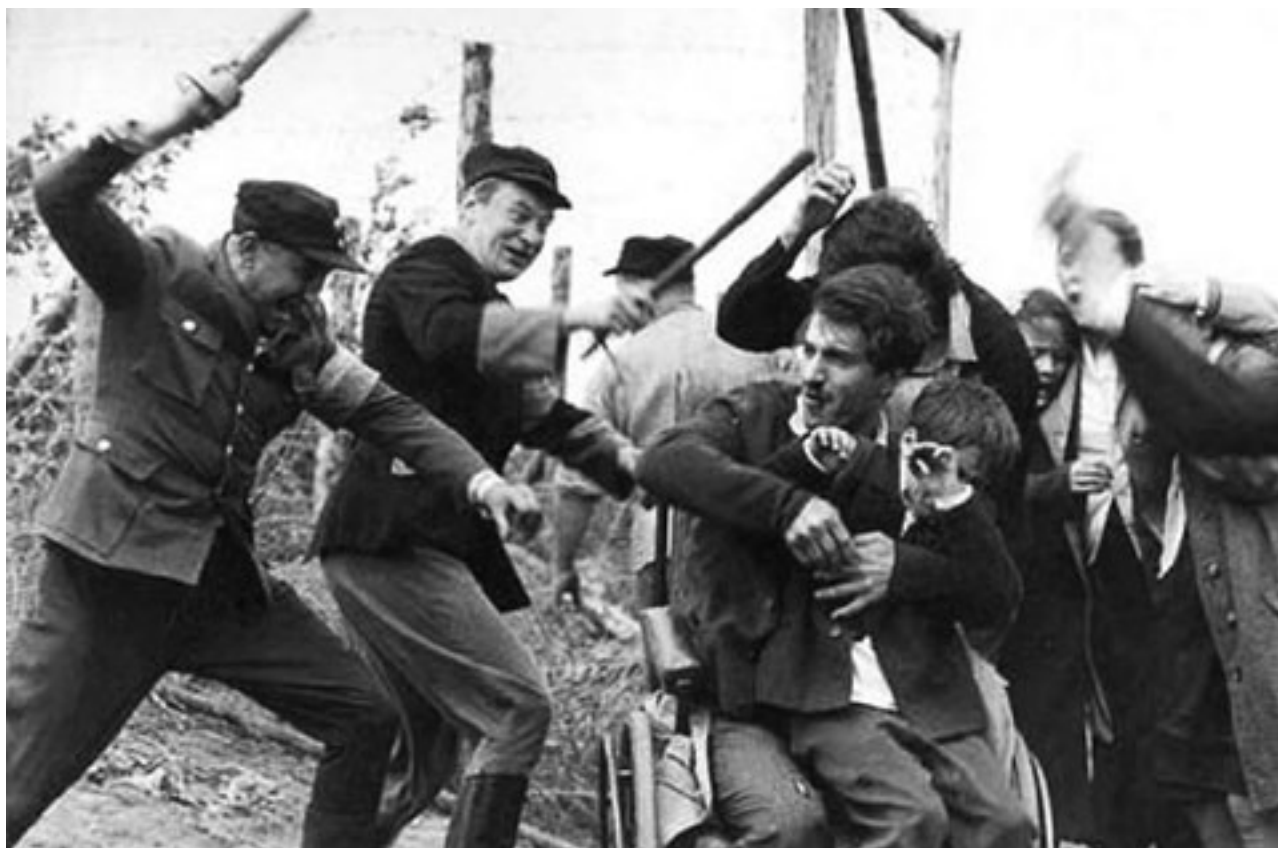
Между 1 и 7 июля 1941 года батальон «Нахтигаль», возглавляемый Романом Шухевичем, вместе с полицией и оуновцами убили во Львове три тысячи поляков и евреев