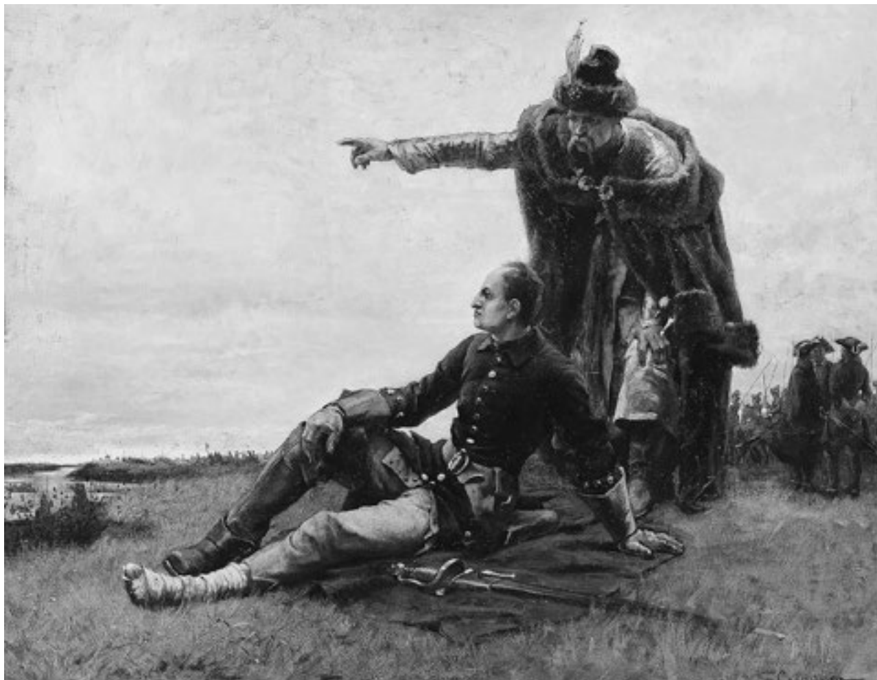
Густав Олаф Цедерстрем, картина «Карл XII и гетман Мазепа после Полтавской битвы»

Имя следующего «героя», Ивана Мазепы, стало нарицательным. Так на Руси с известных пор называют предателей. Но согласно официальной украинской политической версии, главным героем легендарного Полтавского сражения, в котором русские наголову разбили шведского короля Карла XII вкупе с Мазепой, был не Петр I и не Семен Палий, а как раз несчастный гетман.