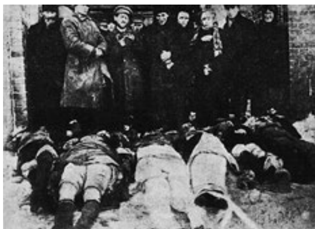
Жертвы петлюровского погрома в Проскурове. Февраль 1919 года