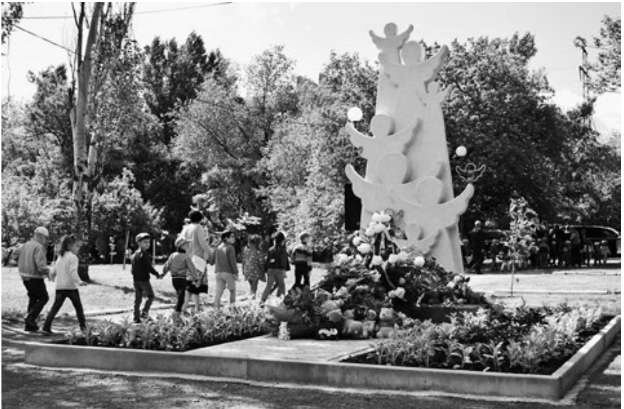
Памятник погибшим детям Луганщины. На момент его открытия (2017 год) украинская агрессия уже унесла 33 детских жизни