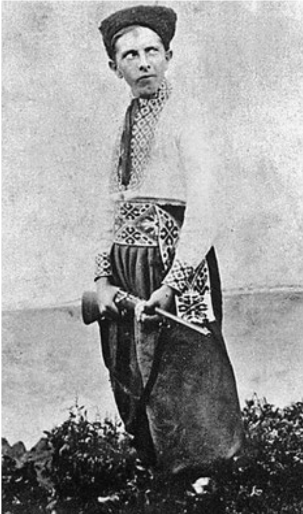
Степан Бандера — пластунок куреня «Червона Калина». 1929-1930 годы

В истории трудно найти фигуру, которая бы меньше подходила на роль национального героя, чем Степан Бандера.