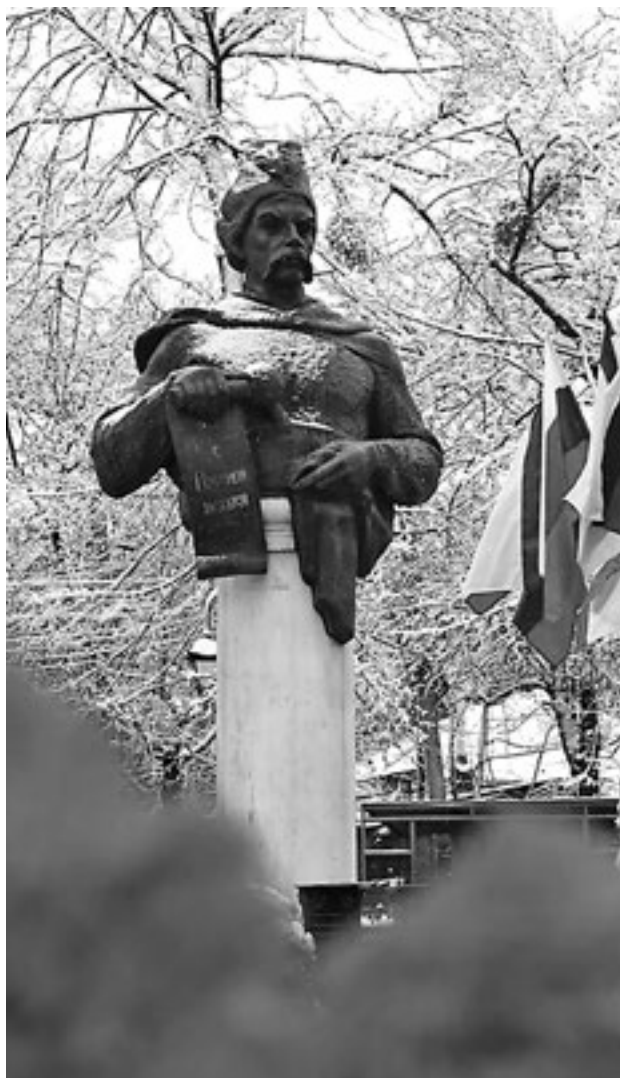
Памятник Богдану Хмельницкому в Симферополе. Республика Крым, Россия

«Богдан Хмельницкий выполнил волю своего народа, и в этом его историческая миссия, — уверен академик. — Не сделай он этого, трудно сказать, появилось бы хоть когда-нибудь на политической карте Европы украинское государство и имели бы мы возможность сегодня обсуждать эту тему».