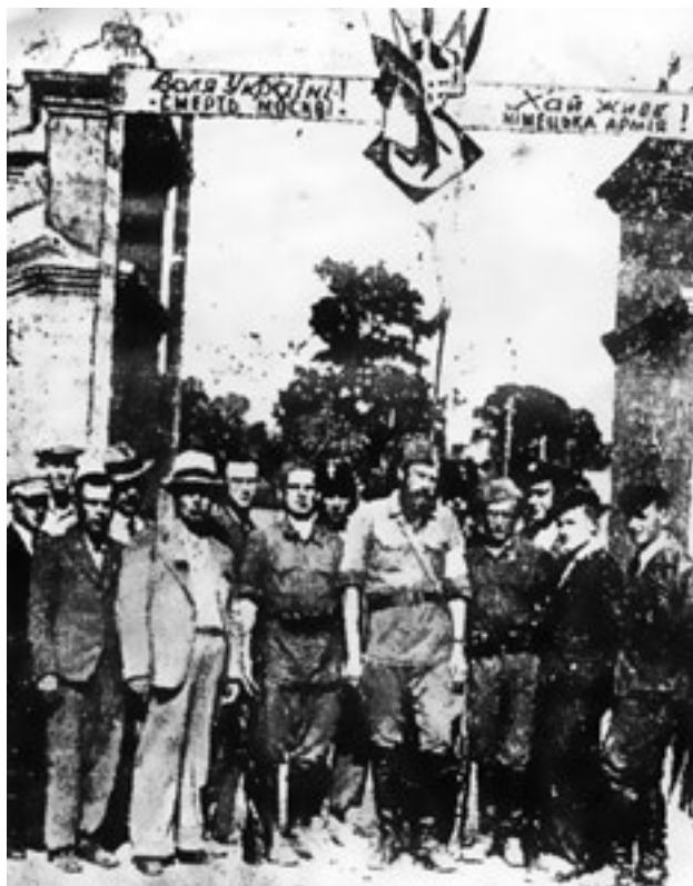
Высокий мужчина с бородой — Тарас Бульба (Боровец), основатель Украинской Повстанческой Армии «Полесская Сечь» (УПА-ПС). Позже название УПА стали использовать бандеровцы, а свою армию Боровец переименовал в УНРА (Украинская народная революционная армия)

новном первый из них — погромом поляков во Львове в 1941 году. Во второй раз Гитлер спас Бандеру в 1944-м — не дал ему попасть в советский плен. Из осажденного Кракова «героя» вывез лично Отто Скорцени — знаменитый диверсант, выкрававший из-под ареста итальянского диктатора Муссолини».