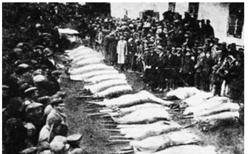
Похороны жертв погрома в Ольгополе Подольской губернии

Так писали об убийстве Петлюры газеты. Тогда они были более объективны, чем западная и украинская пресса сегодня