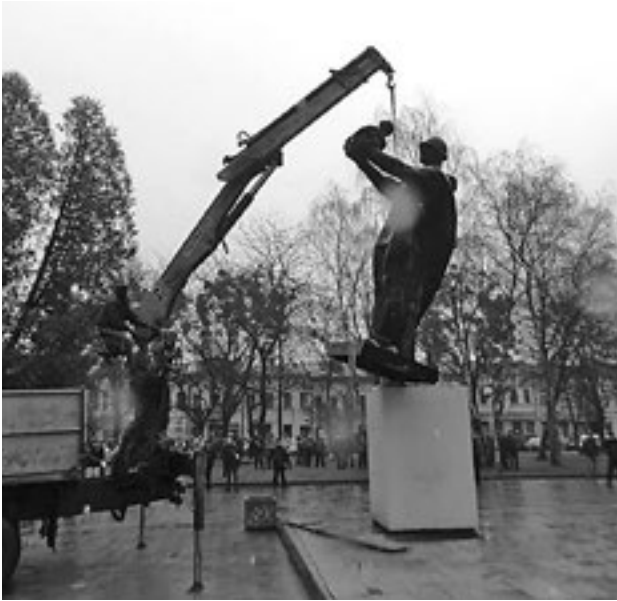
Снос памятника советскому солдату. Стрый Львовской области, 2014 год