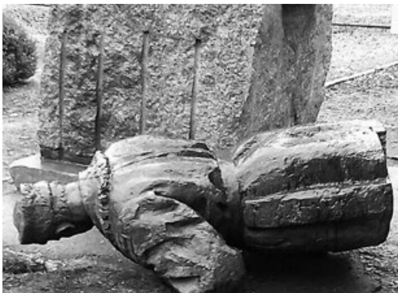
Памятники солдатам Великой Отечественной войны (Кировоградская область, Гайворон, 2018 год) и командиру партизанского соединения Алексею Федорову (Черниговская область, Корюковка, 2017 год)

ропейцам и высокомерия по отношению к России и русским. Представители «высшей расы», потомки «великих укров» почитают за счастье чистить европейские унитазаы и, образно говоря, жить в европейском хлеву с европейскими свиньями. Но при этом русские все равно — «орда», «варвары», «угро-финны» и не ровня гордым потомкам шумеров.