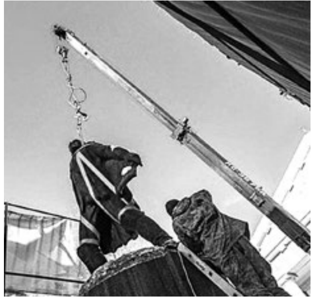
Демонтаж памятника русскому полководцу Суворову. Киев, 2019 год

ми ИГИЛ — от использования мирных граждан в качестве «живого щита» до «социальных роликов» с перерезанием горла «врагам Украины». Эта идеология абсолютно непригодна для государственного строительства, что доказывает и вся короткая история украинской независимости, и вся политика Киева последних лет, которая была основана не на реалиях, а на безумной русофобии, на недостижимых целях и хотелках вроде вступления в НАТО и возвращения Крыма. Да и политические деятели, вынесенные майданом к вершинам власти, — наглядное подтверждение того, до какой степени деградации может дойти человек, продавший память предков ради тухлой бандеровской похлебки.