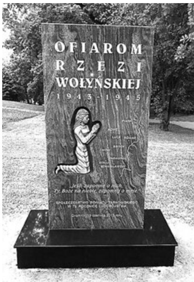
«Если забуду о них, ты, Боже, забудь обо мне». Помнят ли поляки?

Впрочем, бандеровцы «отметились» не только на территории нынешней Украины, но и в соседних странах. Трагедия белорусской Хатыни, жителей которой украинские полицаи сожгли заживо, потрясла весь мир и стала одним из симво-