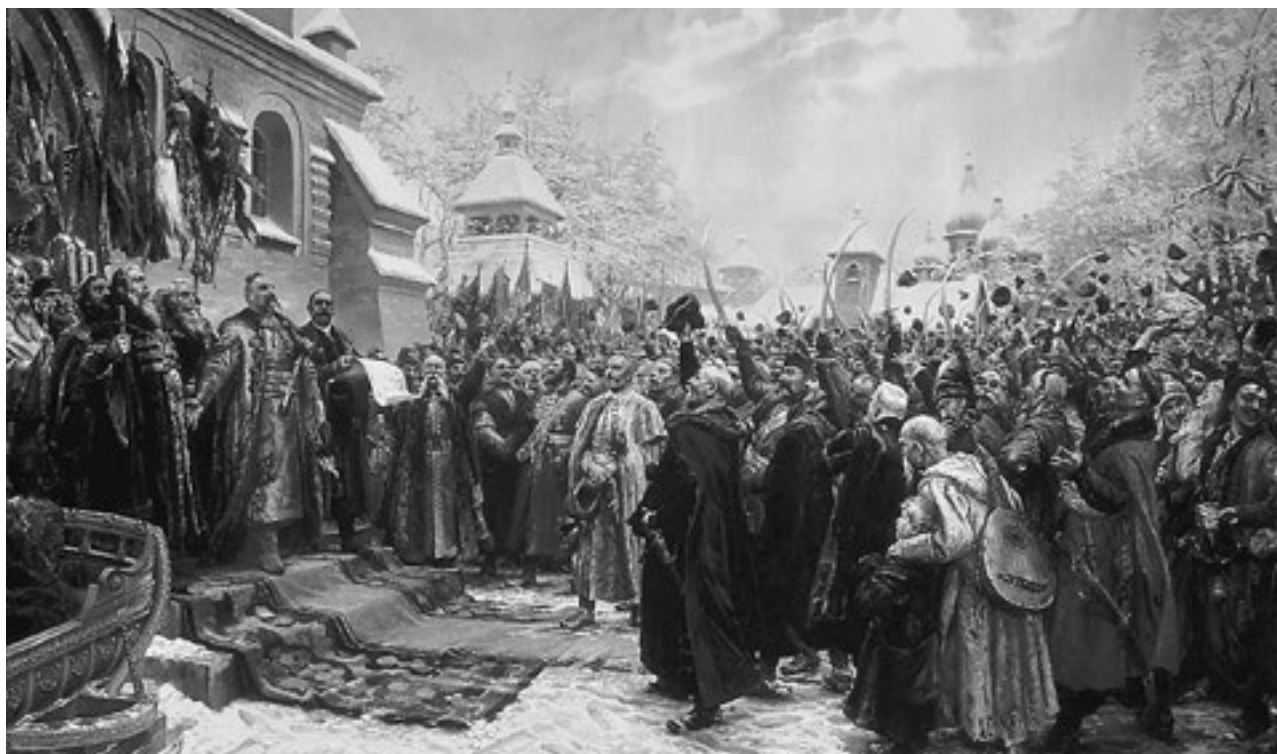
«Навеки с Москвой, навеки с русским народом». Художник Михаил Хмелько, 1951 год

Похожая история произошла и в конце XX века. Утратив единство с Россией, Украина снова оказалась в руках врагов, которые стремятся искоренить все русское, уничтожить каноническое православие. В стране идет гражданская война, в Киеве правит оккупационный режим, ненавидящий язык, веру, историю, культуру людей, которые веками жили на этой земле, проливали за нее кровь, строили и созидали. Население Украины для этого режима и его западных хозяев — даже не холопы, а расходный материал.