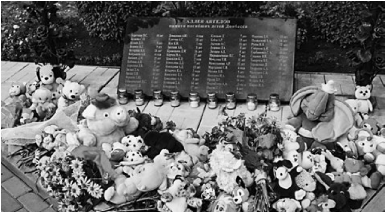
Аллея ангелов — памятник погибшим детям Донбасса, г. Донецк. На плите высечены 66 имен детей, погибших в войне Украины против собственных граждан