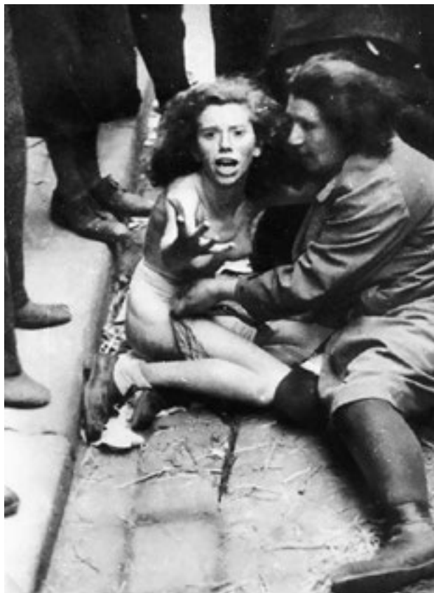
Львовский погром 1941 года. Кровавые наследники бандеровских палачей с таким же наслаждением терзают своих жертв и сегодня

ямах находится до 100 трупов мужчин, женщин и детей, зверски замученных граждан с. Могильницы и его окрестностей, а также пленных красноармейцев. Установлено, что в период немецкой оккупации с. Могильницы в ночь с 17 по 18 марта 1944 года банда украинско-немецких националистов совершила массовое убийство и ограбление граждан с. Могильницы — главным образом польского населения. Банда убийц выламывала двери и окна, врываются в квартиры, расстреливали, резали и убивали топором и ножами людей, в том числе, малолетних детей, стариков и старух, после чего трупы грузили на подводах, отвозили и закапывали в ямах», — из акта о зверствах украинских националистов-бандеровцев, подписанного офицерами Красной армии и жителями нескольких украинских сел.