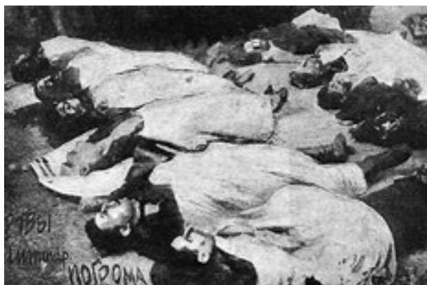
Жертвы второго петлюровского погрома в Житомире

довалось брать жен только из своей среды «в целях спасения казацкой нации от вырождения». Преподавание русского языка было запрещено, в армии шли массовые чистки от «неукраинцев».