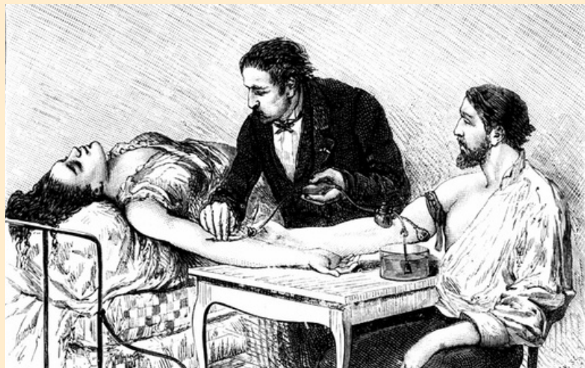
Операция Андрея Вольфа

В России первые пробы переливания крови начинаются в XIX веке. В 1832 году петербургский акушер Андрей Вольф впервые успешно перелил кровь роженице, а донором стал её муж. В то время донацию проводили с помощью специального шприца (гемотрансфузия). Это стало одним из первых задокументированных случаев переливания крови в мире.