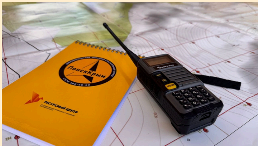
Отряд “ПоискКрым”

— “3 дня с момента пропажи” — это миф. Человек объявляется пропавшим сразу же, как только подаётся заявление. Но мы можем выйти на поиск только после того, как люди заявили в полицию, так как мы все гражданские.