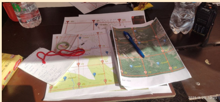
Дело картографов

- Да, тренировочная, конечно, мы никогда не ищем настоящих людей на учебных поисках.