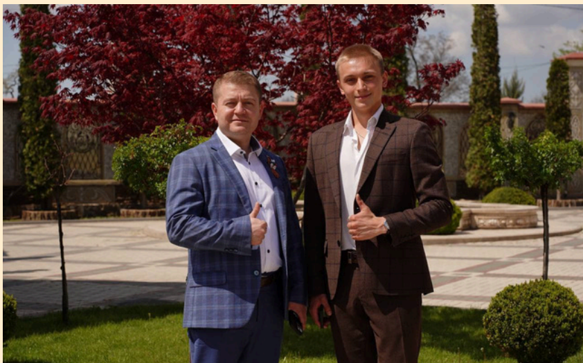
Автор с героем статьи

делать добрые дела, иначе рискуешь многое потерять. Наоборот же, чем больше судьба тебя мучит, даёт испытания, тем больше воздастся потом. Поэтому всем советую одного – никогда не падайте духом. Болят ноги, болит душа, болит сердце, нет денег, плохое здоровье - все равно идти вперед. Потому что другого пути в жизни нет.